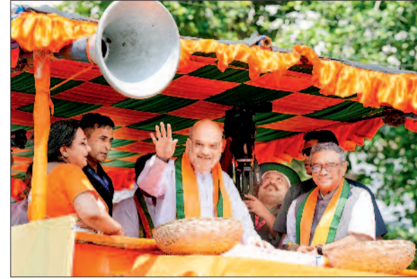
हरिभूमि न्यूज नई दिल्ली

‘मैं 15 दिन तक बंगाल में ही रहूंगा, ममता की होगी विदाई’