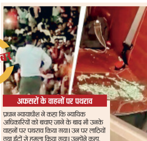
अफसरों के वाहनों पर घेराव

पश्चिम बंगाल के मालदा जिले में मतदाता सूची से नाम हटाए जाने के विरोध में प्रदर्शनकारियों ने एसआईआर में शामिल सात न्यायिक अधिकारियों का कई घंटों तक घेराव किया, जिन्हें बाद में बचा लिया गया। इस बीच, सुप्रीम कोर्ट ने घटना पर नाराजगी जताई। मुख्यमंत्री ममता बनर्जी ने मालदा की घटना से खुद को अलग कर लिया। उन्होंने कहा कि कानून और व्यवस्था अब उनके हाथों में नहीं है। इधर, कोर्ट के आदेश के बाद निर्वाचन आयोग ने जांच का जिम्मा एनआईए को सौंप दिया।