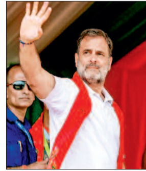
हरिभूमि न्यूज नई दिल्ली

असम में 9 अप्रैल को मतदान होना है। कांग्रेस नेता राहुल गांधी ने गुरुवार को असम विधानसभा चुनाव के लिए पार्टी का घोषणा पत्र जारी किया। इस घोषणा पत्र में शासन, पहचान और स्वास्थ्य जैसे 11 क्षेत्रों पर फोकस किया गया है। यह घोषणा पत्र एक चुनावी रैली के दौरान जारी किया गया, जिसमें राहुल गांधी के साथ असम कांग्रेस अध्यक्ष गौरव गोर्गोई और अन्य वरिष्ठ नेता मौजूद थे। घोषणा पत्र में कुल 11 संकल्प शामिल हैं- शासन, पहचान, स्वास्थ्य, बुनियादी ढांचा विकास, औद्योगिकरण, कृषि, ग्रामीण और शहरी विकास, जलवायु परिवर्तन और सुरक्षित असम। इस दौरान, राहुल ने आरोप लगाते हुए कहा, असम के मुख्यमंत्री हिंदुस्तान के सबसे भ्रष्ट मुख्यमंत्री हैं। इनका नियंत्रण नरेंद्र मोदी और शाह के हाथ में है। अगर नरेंद्र मोदी इनसे कहेंगे कि उठलो तो यह उठलेंगे। अगर नरेंद्र मोदी इनसे कहेंगे कि अमित शाह के पैर पकड़ो, तो यह उनके पैर पकड़ेंगे। यह सच्चाई है। डोनाल्ड ट्रंप नरेंद्र मोदी को नियंत्रित करते हैं और नरेंद्र मोदी आपके मुख्यमंत्री को नियंत्रित करते हैं।