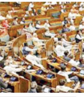
खड़गे का आरोप, रिजिजू के जवाब

मीडिया रिपोर्ट्स की माने तो इस विशेष सत्र के दौरान संविधान संशोधन विधेयक पेश किया जा सकता है। जिसके माध्यम से नारी शक्ति वंचन अधिनियम में संशोधन संभव है। इस दौरान महिला आरक्षण कानून से जुड़े संविधान संशोधन पर चर्चा हो सकती है।