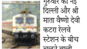
स्पेशल ट्रेन की 40 अतिरिक्त फेरियां की घोषणा की। ट्रेन की जबरदस्त लोकप्रियता को देखते हुए, 15 अप्रैल से 16 जुलाई तक ट्रेन की सेवा बढ़ाने की मंजूरी दे दी गई है।

नई दिल्ली। उत्तरी रेलवे के जम्मू डिविजन ने ऐसे में भीड़ से निपटने के लिए ठोस तैयारी की है। उसने गुरुवार को नई दिल्ली और श्री माता वैष्णो देवी कटरा रेलवे स्टेशन के बीच चलने वाली स्पेशल ट्रेन की 40 अतिरिक्त फेरियां की घोषणा की। ट्रेन की जबरदस्त लोकप्रियता को देखते हुए, 15 अप्रैल से 16 जुलाई तक ट्रेन की सेवा बढ़ाने की मंजूरी दे दी गई है।